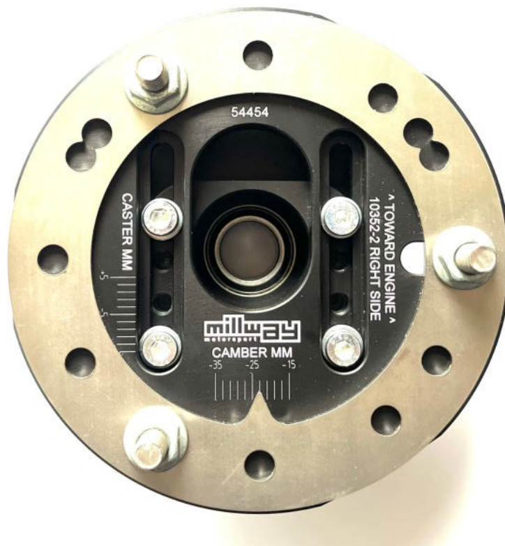
Rodamientos de puntal ajustables (Uniball): 54454

Salvo error o modificación. Las instrucciones de instalación actuales del producto correspondiente también pueden consultarse en www.burkhart-engineering.com .