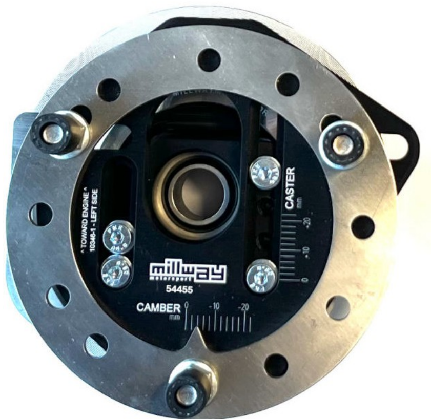
Cuscinetti regolabili per puntoni (Uniball): 54455

Salvo errori e modifiche. Le istruzioni di installazione aggiornate per i rispettivi prodotti sono disponibili anche sul sito www.burkhart-engineering.com .