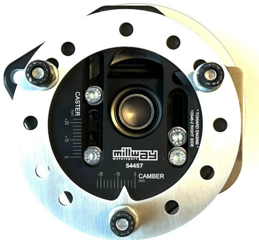
Paliers de domino réglables (Uniball) : 54457

Sous réserve d'erreurs et de modifications. Les instructions de montage actuelles pour chaque produit sont également disponibles sur www.burkhart-engineering.com .