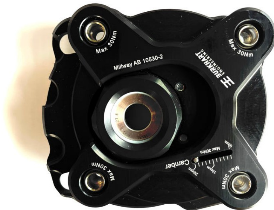
Paliers de domino réglables (Street) : 5513G

Sous réserve d'erreurs et de modifications. Les instructions de montage actuelles pour chaque produit sont également disponibles sur www.burkhart-engineering.com .