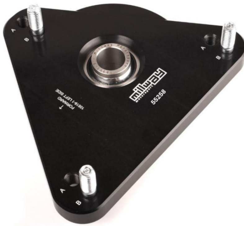
Cuscinetti cupola regolabili (Uniball): 55258

Soggetto a errori e modifiche. Le attuali istruzioni di installazione per il rispettivo prodotto sono disponibili anche su www.burkhart-engineering.com trovare.