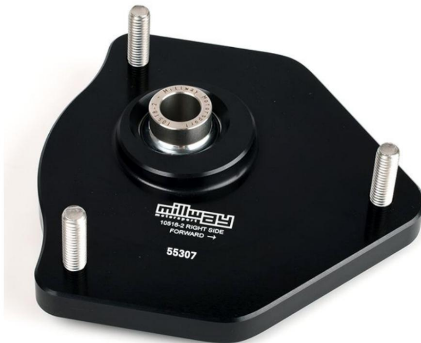
Domlager (Uniball) : 55307

Sous réserve d'erreurs et de modifications. Les instructions d'installation actuelles pour le produit concerné sont également disponibles