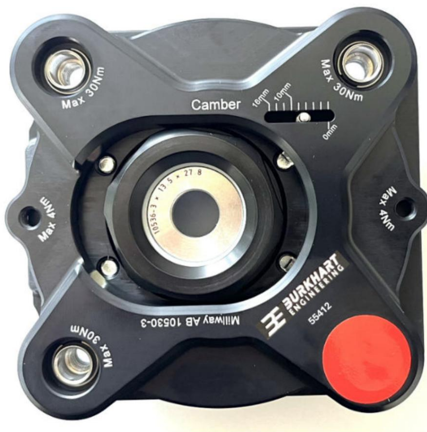
Rodamientos de cúpula ajustable (Street): 55412

Sujeto a errores y cambios. También se encuentran disponibles las instrucciones de instalación actuales para el producto respectivo.