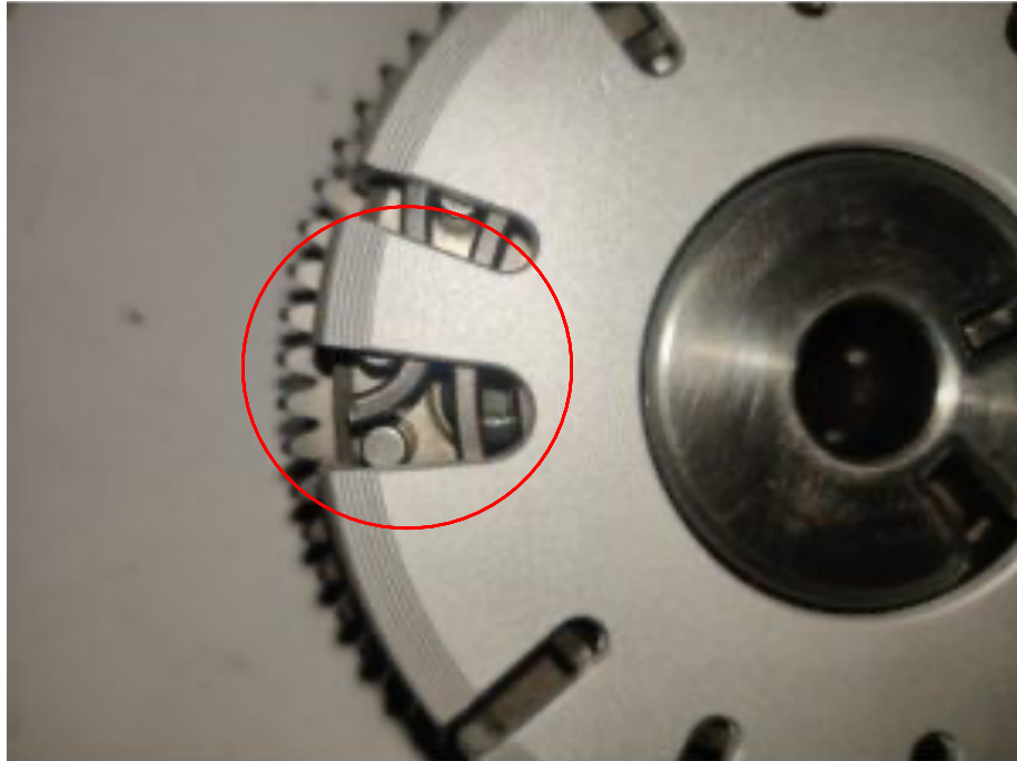
Abbildung 2: Der schmalste Flügel mit der größten Aussparung muss so positioniert werden, dass das äußere Ende der Spiralfeder der Vanos-Verstellereinrichtung zu sehen ist.