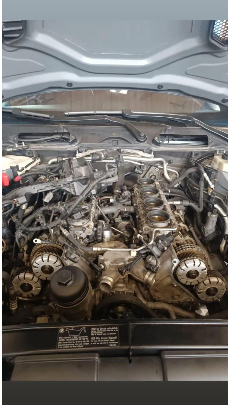
Abbildung 4: Ergebnis der Arbeit