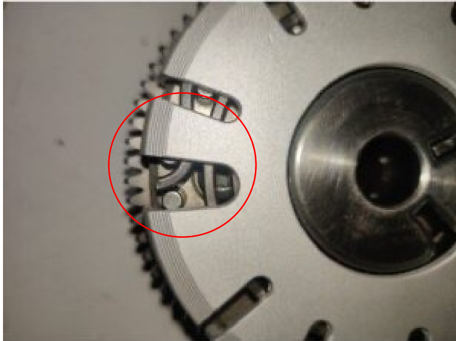
Figura 2: La hoja más estrecha con el hueco más grande debe colocarse de modo que el extremo exterior del muelle espiral del dispositivo de ajuste Vanos quede visible.