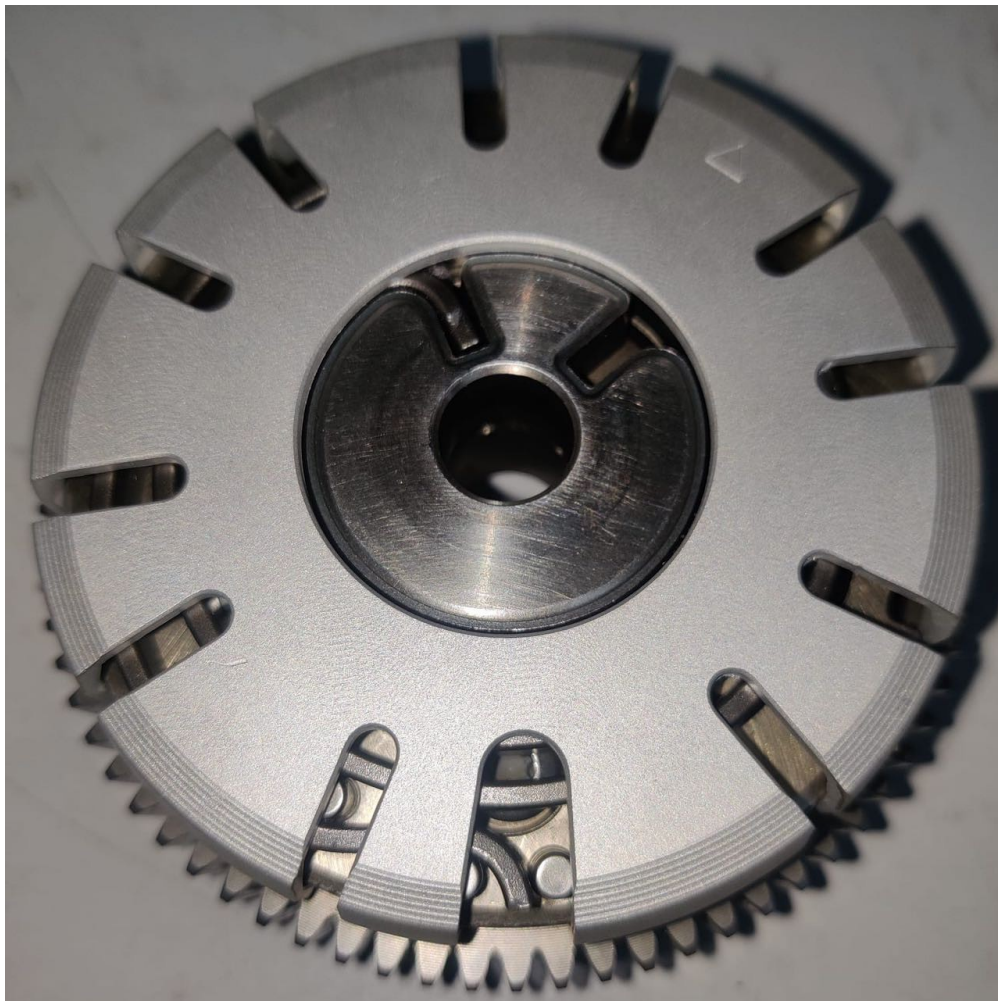
Figura 1: Asegúrese de que la cubierta se empuja en línea recta desde arriba sin inclinarla, de modo que todas las "alas" encajen en su sitio. Observe el posicionamiento en el sentido de giro como se muestra en las siguientes imágenes.