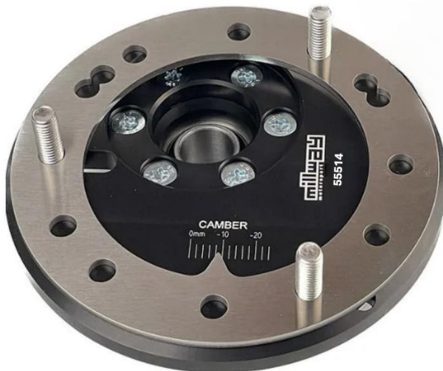
Roulements à dôme réglable (Uniball) : 55514

Sous réserve d'erreurs et de modifications. Les instructions d'installation actuelles pour le produit concerné sont également disponibles