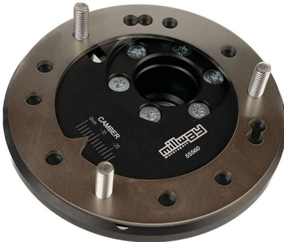
Roulements à dôme réglable (Uniball) : 55560

Sous réserve d'erreurs et de modifications. Les instructions d'installation actuelles pour le produit concerné sont également disponibles sur www.burkhart-engineering.com à trouver.