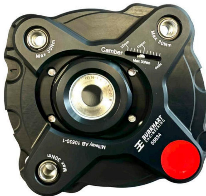
Cuscinetti cupola regolabili (Street): 55634

Soggetto a errori e modifiche. Le attuali istruzioni di installazione per il rispettivo prodotto sono disponibili anche su www.burkhart-engineering.com trovare.