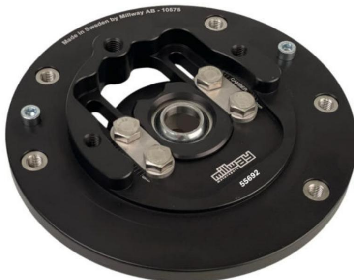
Cuscinetti cupola regolabili (Uniball): 55692

Soggetto a errori e modifiche. Sono inoltre disponibili le istruzioni di installazione attuali per il rispettivo prodotto